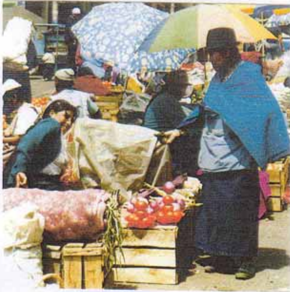
Im Markt von San Roque