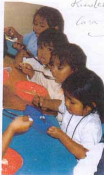
Kindergarten Casa del Sol

Zur Situation: Im Stadtrandviertel nahe dem Casa Sol leben viele alleingelassene Frauen mit Kindern. Es gibt keine soziale Absicherung in Ecuador, weshalb die Mütter zur Arbeit gehen müssen, um sich und die Kinder zu ernähren. Weil man aber die Kleinen nicht zur Arbeit mitnehmen kann, werden sie den ganzen Tag in der Hütte eingesperrt (Babys im Bett festgebunden), was zu Krankheit, Todesfällen, und auf jeden Fall immer zu einer Unterentwicklung dieser armen Kinder führt. Im „Casa del Sol“ bekommen sie nicht nur ausgewogene Nahrung, sondern auch liebevolle Betreuung und Erziehung.